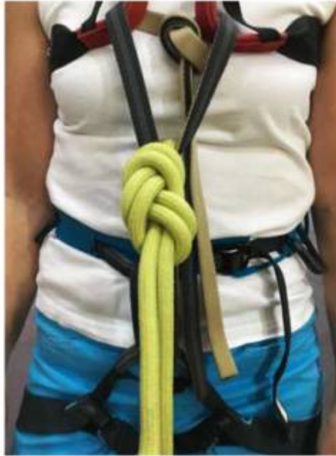
10. Dovázání osmičkového uzlu.